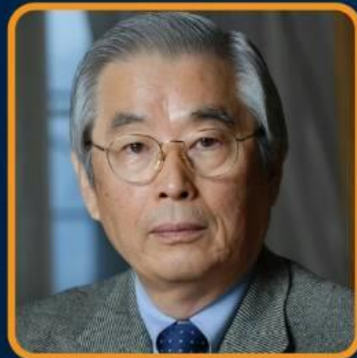
Prof. Dr. Sumio Iijima Meijo University, Japan Topic : Nanoscience and electron microscopy